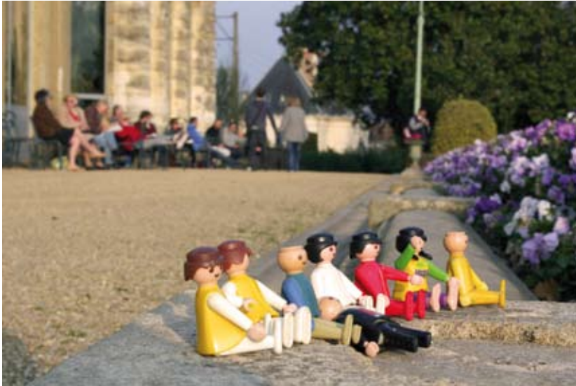
Romain Louvel, Les Gens se détendent ('People are relaxing'), 2012 - «Expéditions» Project, Rennes

Please, respect captions and copyrights.