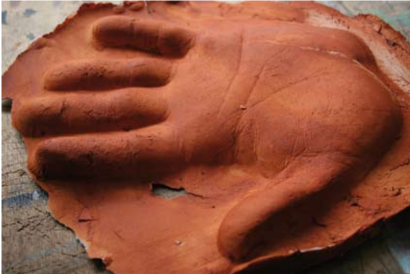
Romain Louvel, Collecte d'empreintes ('Collection of impressions'), 2012 - «Expéditions» Project, Rennes

Please, respect captions and copyrights.