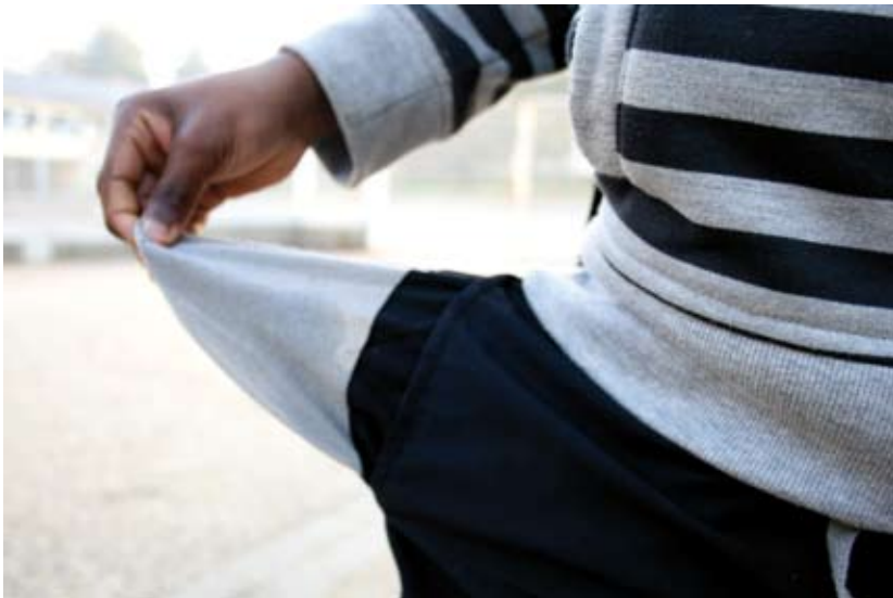
Pierre Grosdemouge, Interdiction d'avoir des objets dans ses poches à l'école ('No items allowed in pockets at school'), 2012 - «Expéditions» Project, Rennes © Pierre Grosdemouge